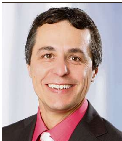
Ignazio Cassis, il sulet candidat la la Svizra italo-fona.

Per ina candidatura italo-fona dubla Geabain, in Tessinais per represchentar sia cuminanza linguistica. Ma pertge mo in candidat? La pld dal chantun vul preschentar mo ina persuna: Cuss. naz. Ignazio Cassis (*1961). A la pld dal Vad, in chantun romand, pia «latin», dat quai mustgas da preschentar in'atgna persuna-